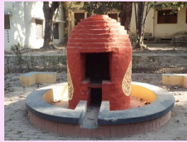
Four à poterie