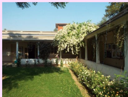
Patio donnant sur des salles de classes

Or, Brigitte Macron a enseigné dans une école Montessori et s'est aussi intéressée aux Ecoles Steiner et Krishnamurti. Raison pour laquelle, venant à Varanasi, elle devait connaître l'existence de l'Ecole de Raj Ghat. Elle a donc demandé à la visiter et à rencontrer les élèves et les enseignants.