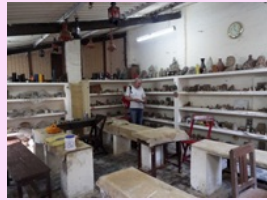
Atelier de poterie