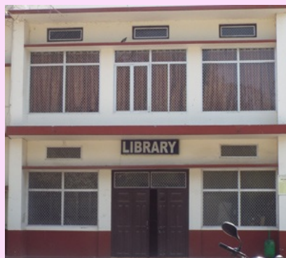
Bibliothèque de l'école Besant

Cette restitution a été établie à partir de la narration des personnes présentes, en fonction de nos questions, d'articles de presse, de pages web des sites dédiés. Les photos de la visite officielle proviennent de l'école.