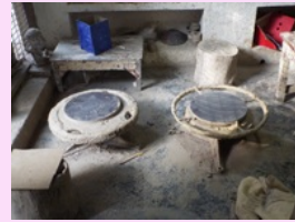
Tour à poterie