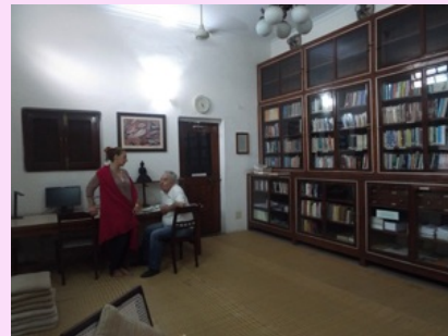
Bibliothèque du centre

La véranda ouverte sur le jardin est souvent un lieu de flânerie et de rencontres avec les résidents du centre.