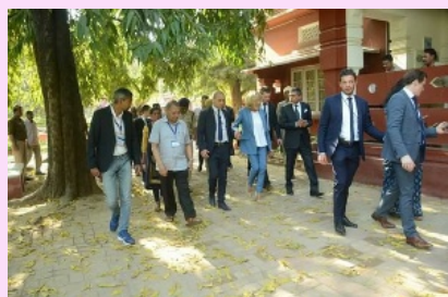
Arrivée au centre de retraite